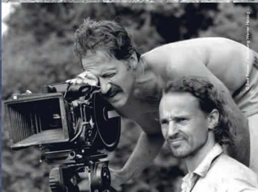
© Beate Pfeiffer / Fotowang Werner Herzog